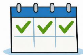
Chodím alespoň 3x týdně