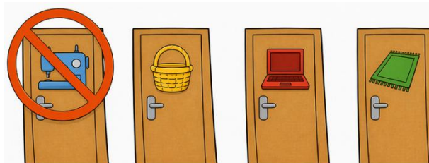
Dílna je zavřená, půjdu do jiné.