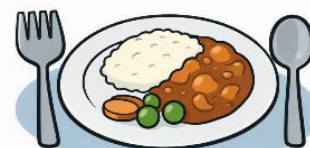
Oběd 11:30 - 12:30