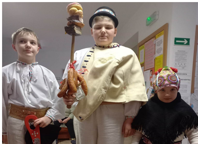
Dům s pečovatelskou službou Strání