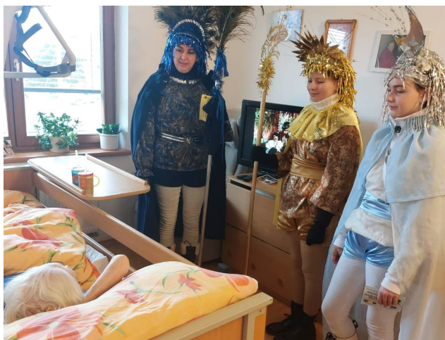
Charitní dům Vlčnov