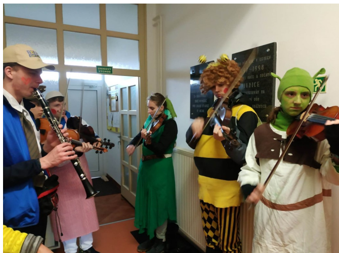
Charitní dům Nivnice