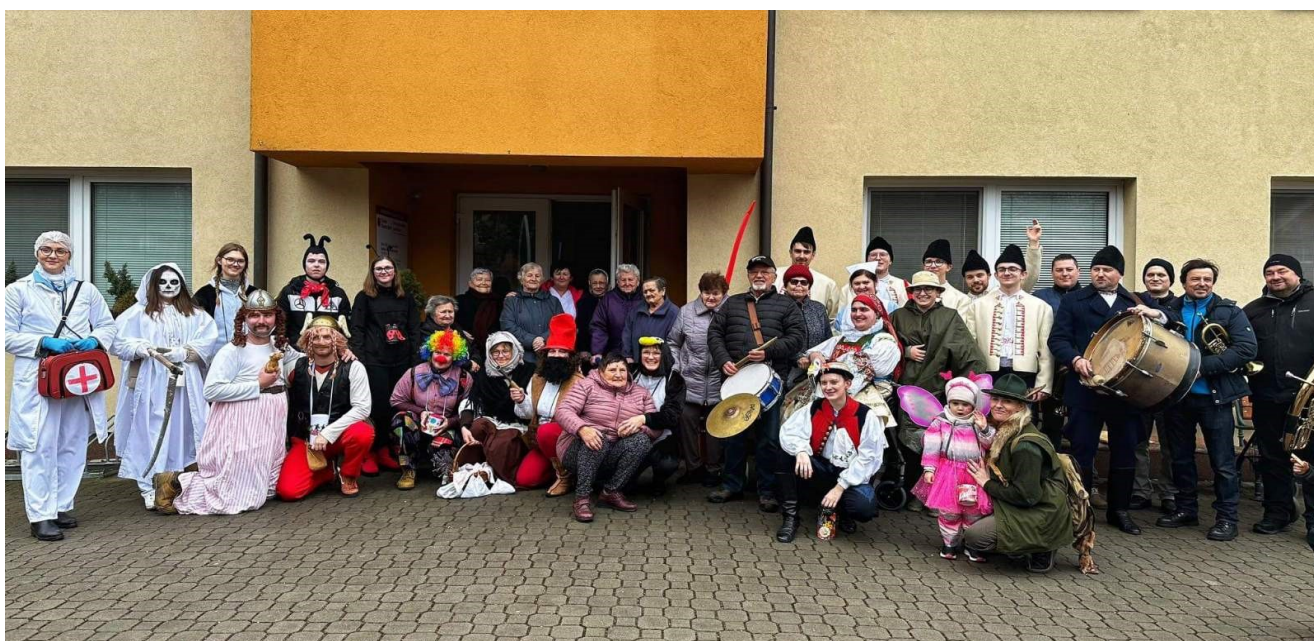
Dům s pečovatelskou službou Dolní Němčí