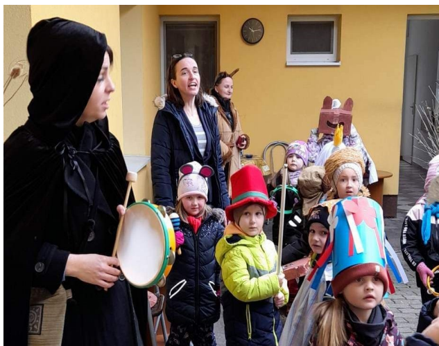
Charitní dům Horní Němčí